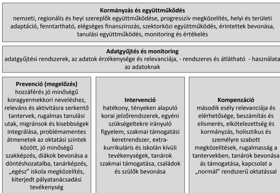
1. ábra: A végzettség nélküli iskolaelhagyás szektorközi megközelítései